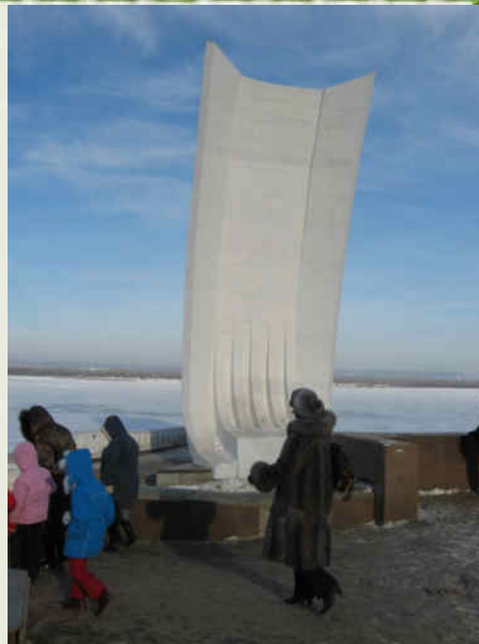
по городу: у Ладьи