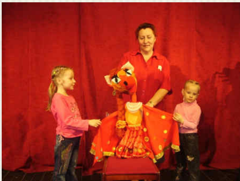
В кукольный театр