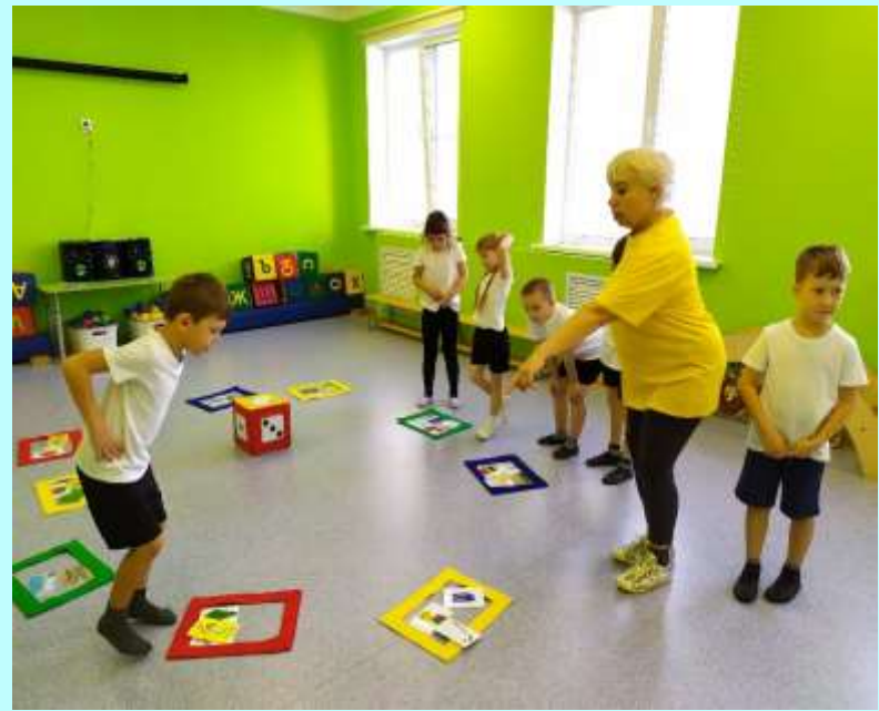
Пловец на старте