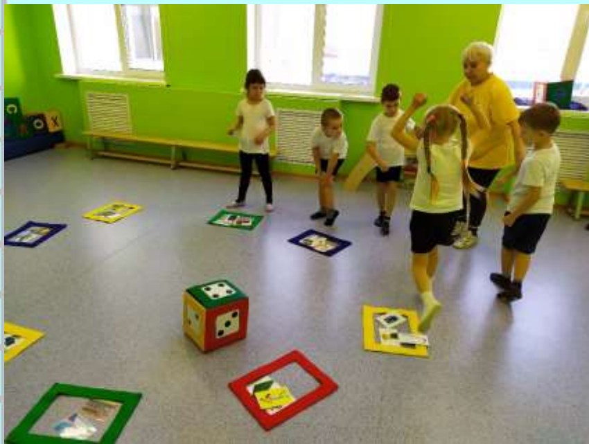
Аккуратнее , футболист выполняет пенальти

Побеждает тот, кто первым дойдет до финиша и заполнит карточками с предметными картинками свой разноцветный куб.